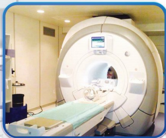
ОПТИМА MR450w GE HEALTHCARE

ОБЛАДНАННЯ ПРОВІДНИХ СВІТОВИХ ВИРОБНИКІВ