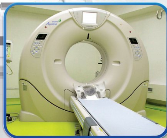
TOSHIBA AQUILION PRIME

ОБЛАДНАННЯ ПРОВІДНИХ СВІТОВИХ ВИРОБНИКІВ