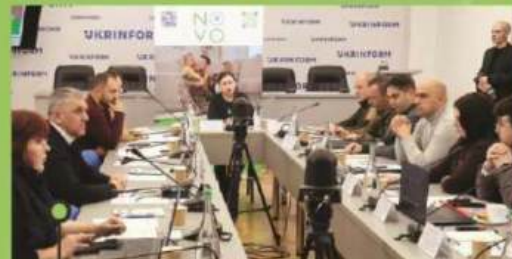
засідання Круглого столу. 23 січня 2024 р. м. Київ