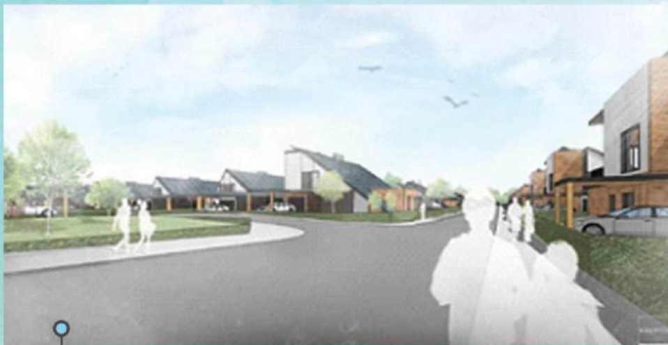
візуал проекту “ReNOVO”

МЕТА: ПІДТРИМКА ВІЙСЬКОВОСЛУЖБОВЦІВ ШЛЯХОМ ЗАБЕЗПЕЧЕННЯ ДОСТУПУ ДО НЕОБХІДНИХ МЕДИЧНИХ СЕРВІСІВ.