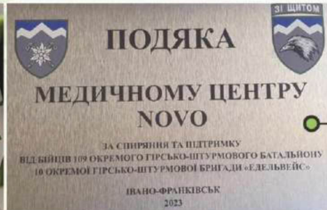
Подяка від гірсько-штурмової бригади "Едельвейс"