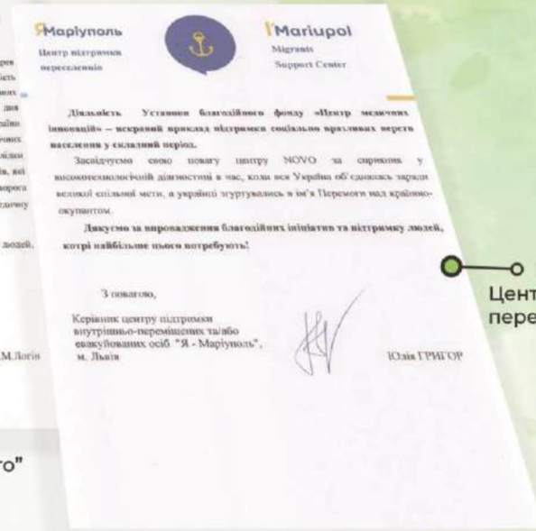
Подяка від Центру підтримки переселенців ЯМариуполь"