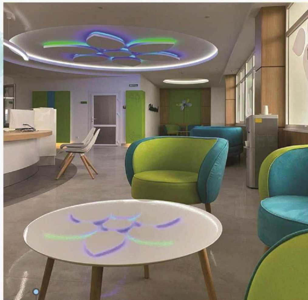
○ одне з відремонтованих приміщень