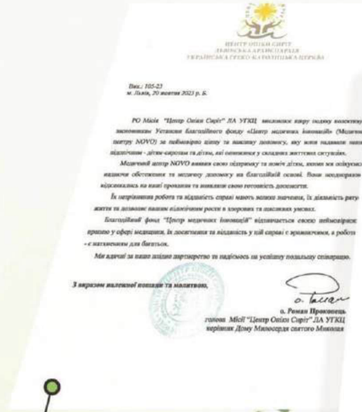
Подяка від "Центру опіки сиріт" за багаторічну допомогу дітям, позбавленим батьківського піклування