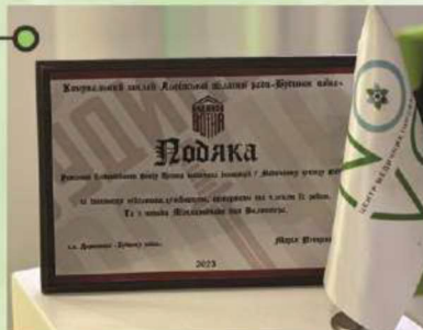
Подяка від КЗ ЛОР "Будинок Воїна" за допомогу військовим та членам їхніх родин