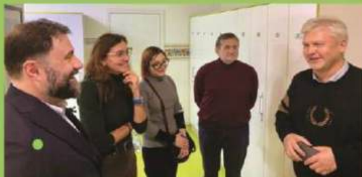
візит грантодавців 14 листопада 2023 р.