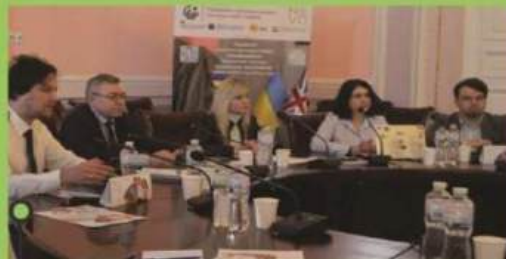
проведення Фокус-групи 9 січня 2024 р.