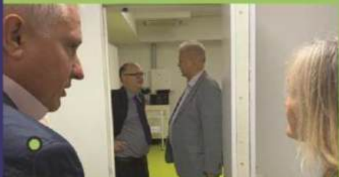
візит представників Посольства Великої Британії 10 жовтня 2023 р.