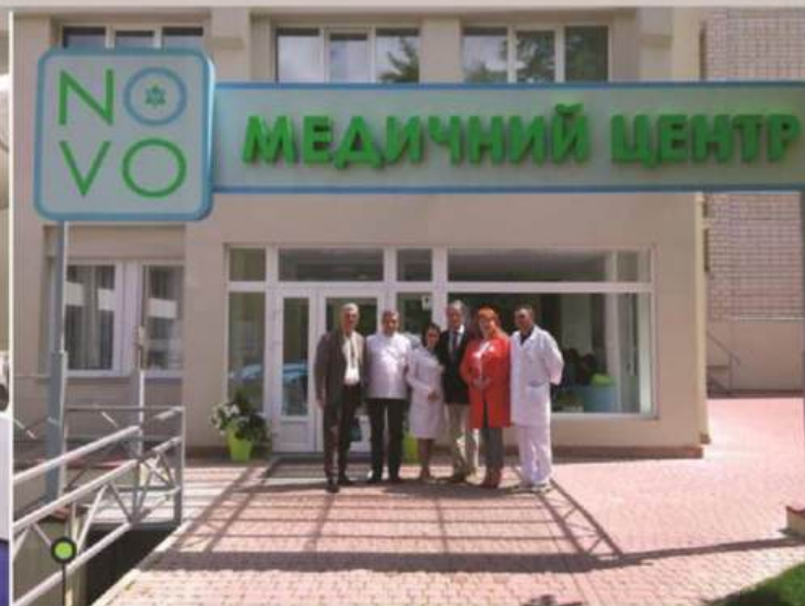
Президент України Віктор Ющенко з керівництвом NOVO