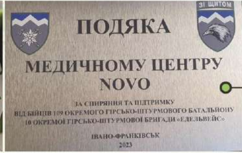
Подяка від гірсько-штурмової бригади "Едельвейс"