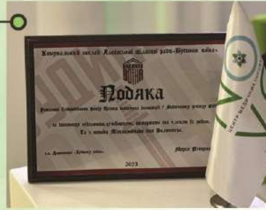
Подяка від КЗ ЛОР "Будинок Воїна" за допомогу військовим та членам їхніх родин