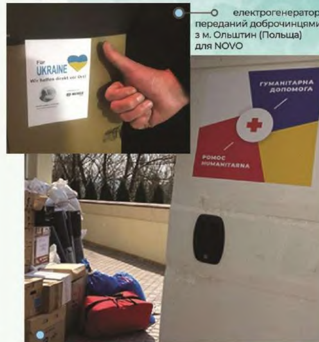
електрогенератор, переданий доброчинцями з м. Ольштин (Польща) для NOVO

ДОПОМОГА ПРИВАТНИХ ЖЕРТВОДАВЦІВ З США, ПОЛЬЩІ, НІМЕЧЧИНИ МЕДИЧНИМ, ТЕХНОЛОГІЧНИМ ОБЛАДНАННЯМ, МЕДИКАМЕНТАМИ ТА ФІНАНСАМИ НА ЗАГАЛЬНУ СУМУ ПОНАД 250 000 $