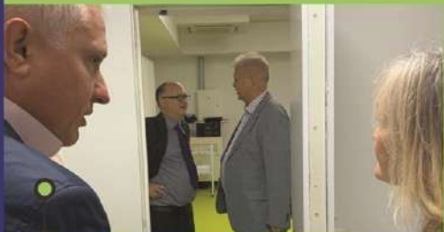
візит представників Посольства Великої Британії 10 жовтня 2023 р.