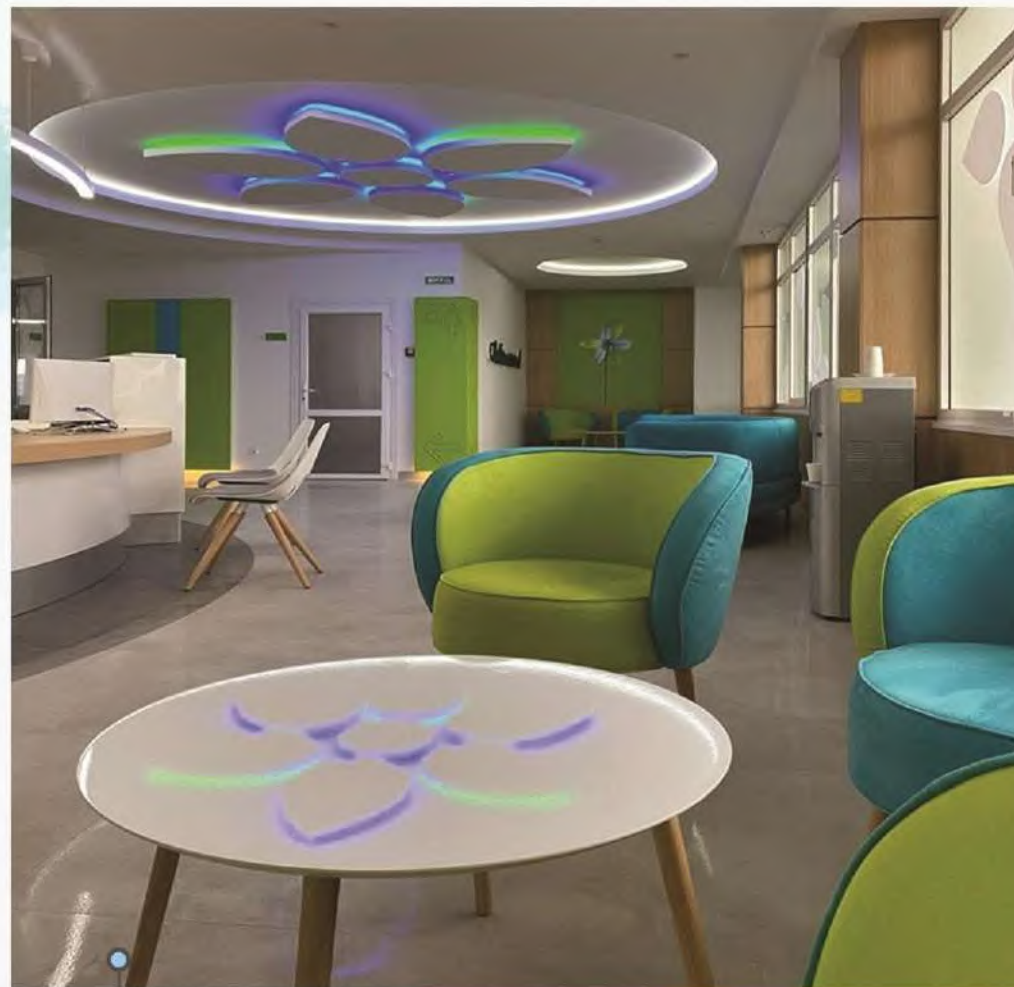
○ одне з відремонтованих приміщень