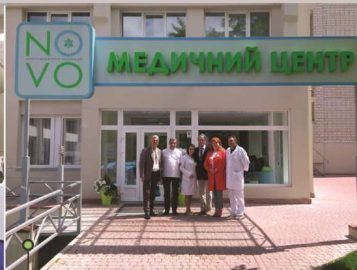
Президент України Віктор Ющенко з керівництвом NOVO