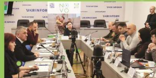
засідання Круглого столу. 23 січня 2024 р. м. Київ