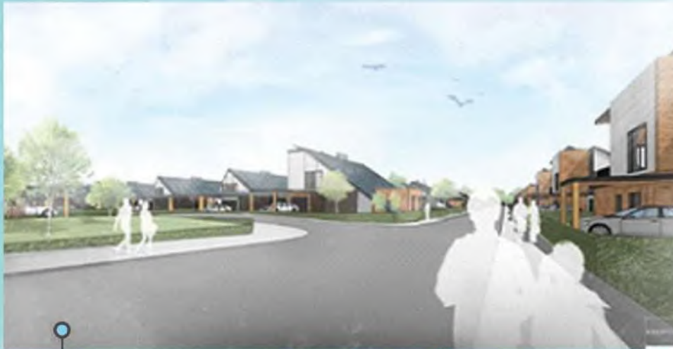
візуал проекту “ReNOVO”

МЕТА: ПІДТРИМКА ВІЙСЬКОВОСЛУЖБОВЦІВ ШЛЯХОМ ЗАБЕЗПЕЧЕННЯ ДОСТУПУ ДО НЕОБХІДНИХ МЕДИЧНИХ СЕРВІСІВ.