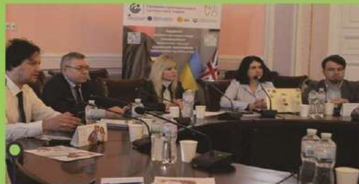
проведення Фокус-групи 9 січня 2024 р.