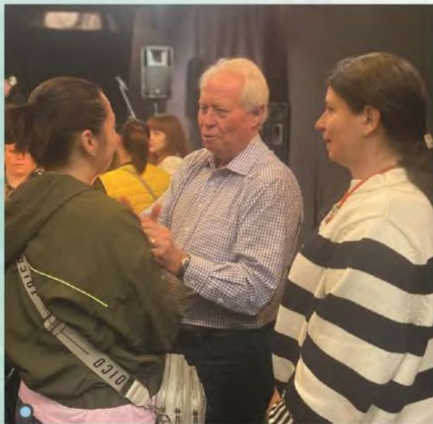
Делл Лой Хансен на зустрічі з вимушено переміщеними родинами, котрі постраждали внаслідок повномасштабного вторгнення, 2022 р.

ФУНДАЦІЯ СІМ'Ї ДЕЛЛА ЛОЯ ХАНСЕНА (США) ЗА ПОСЕРЕДНИЦТВОМ NOVO НАДАЛА ФІНАНСОВУ БЛАГОДІЙНУ ДОПОМОГУ ДЛЯ ВНУТРІШНЬО ПЕРЕМІЩЕНИХ ОСІБ НА СУМУ 135 000 $