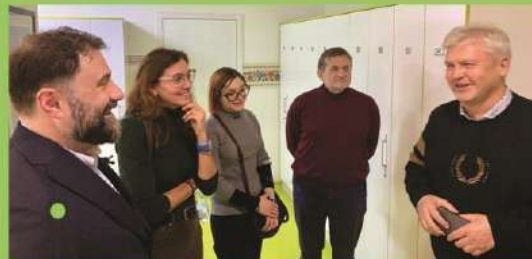
візит грантодавців 14 листопада 2023 р.